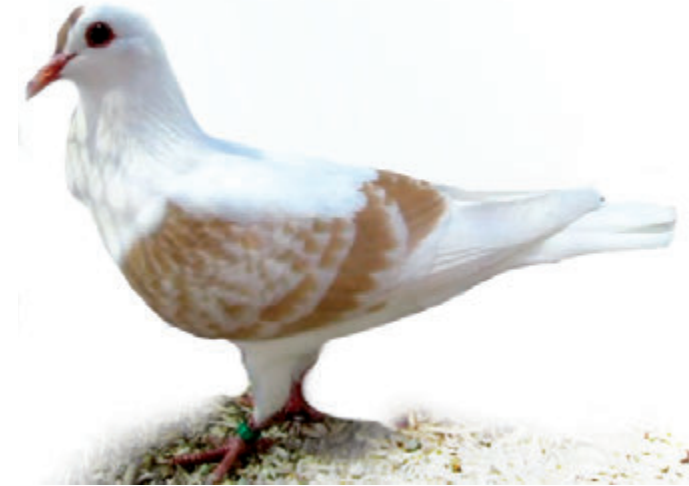
Rasse des Jahres: Thüringer Flügeltaube