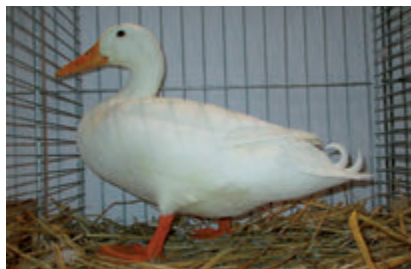
Siegerring 1: Warzenenten, Hochbrutflugenten, Cayugaenten, Landenten, Deutsche Campbellenten